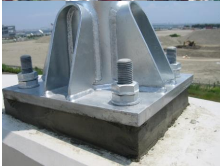
照明柱アンカー部（首都高速道路）