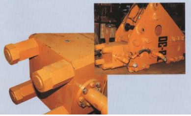
油圧ブレーカータイロッド止め