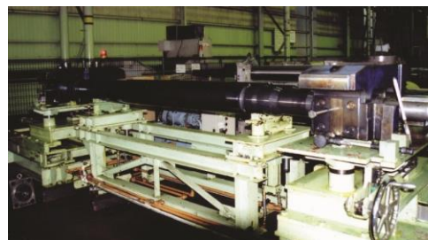
製鉄機械(矯正ロール止め)