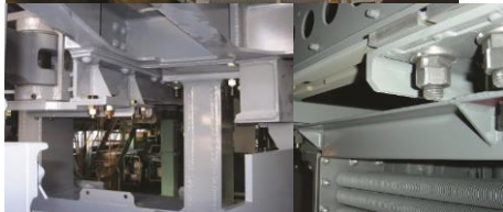
新幹線車両機器取付ボルト