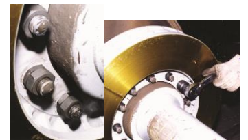
ディスクブレーキ