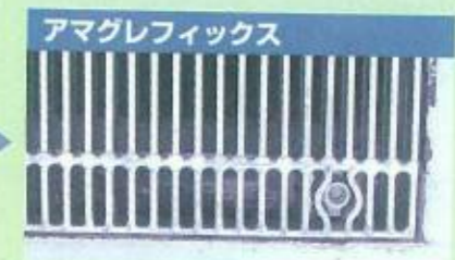
アマグレフィックス