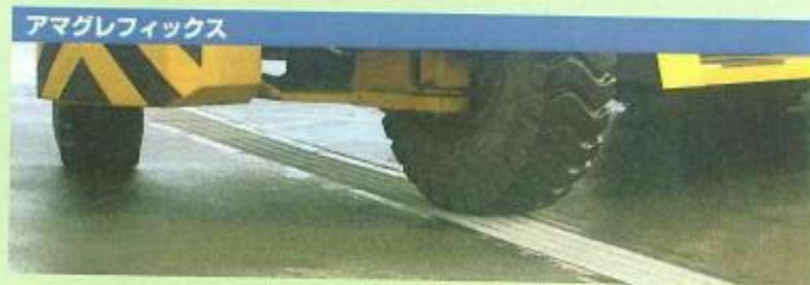
アマグレフィックス