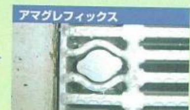
アマグレフィックス