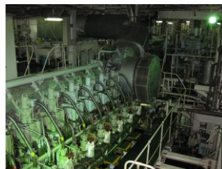
船舶エンジン締結箇所