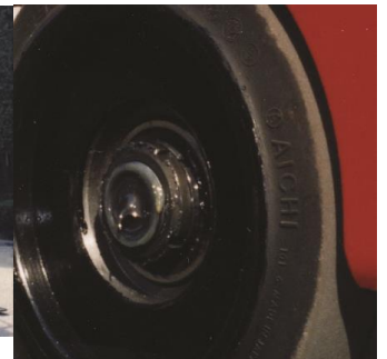
フォークリフト車輪軸止め