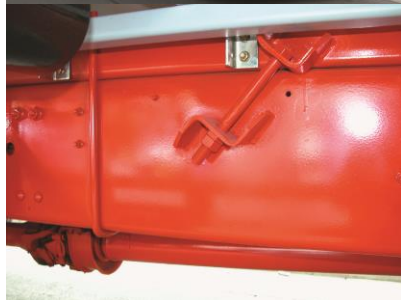
特装车 フレーム取付