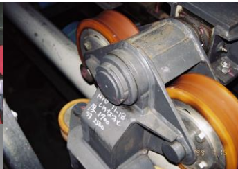
ジェットコースターガイドローラー