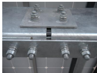
太陽光パネル架台